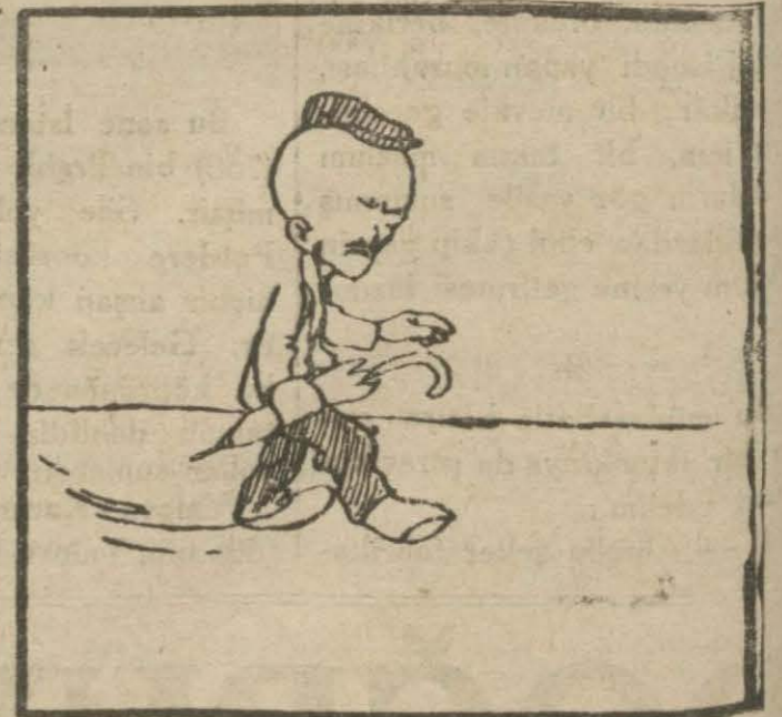
4: Hasan Bey — Hele suların pisliğinden bir de tifo hastalığına yakalanıp bir ay yatmalı ki beler diyenin vazifelerini anlasın!