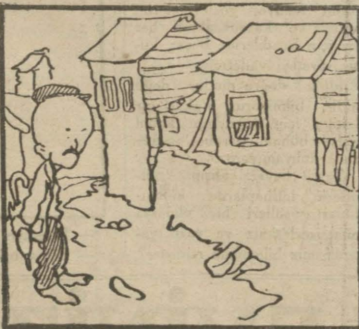
2: Hasan Bey — Geceleri karanlık, gündüzleri tozlu, bataklık bir mahallede oturmalı.