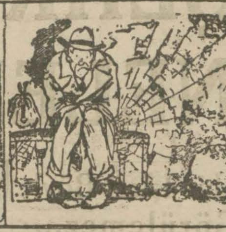
4 — Sizin de böyle ayağınızda bir zincir var mıdır? Herşeyden evvel bu zinciri çözmiye çalışınız.