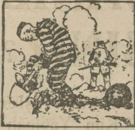
1 — Ayağı zincirle bağlı olan bu mahpus hiçbir yere kımlı diyamaz.