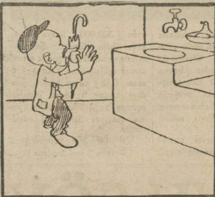
3: Hasan Bey — Evinde Terkos musluğu akmalah ve yüzünü yıkıyacak su bulamamalı.