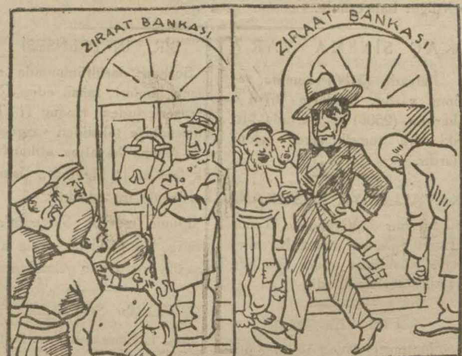
Türk çiftçisi banka kapılarında aç ve çıplak beklerken.. Ali Naci B., İsmet Paşayı müdafaa için Ziraat bankasından (35) bin lira almıştır. [Yarın]