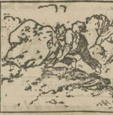
2 — İşte atalet te böyle bir şeydir. İnsan bir yere mihlayıp hareketten mahrum eder.