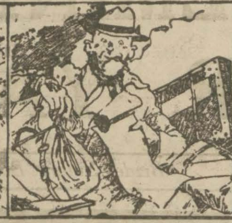
3 — Bazı kimseler hayatları için muntazam bir program tanzim eder ve onu takip ederek yürür giderler.